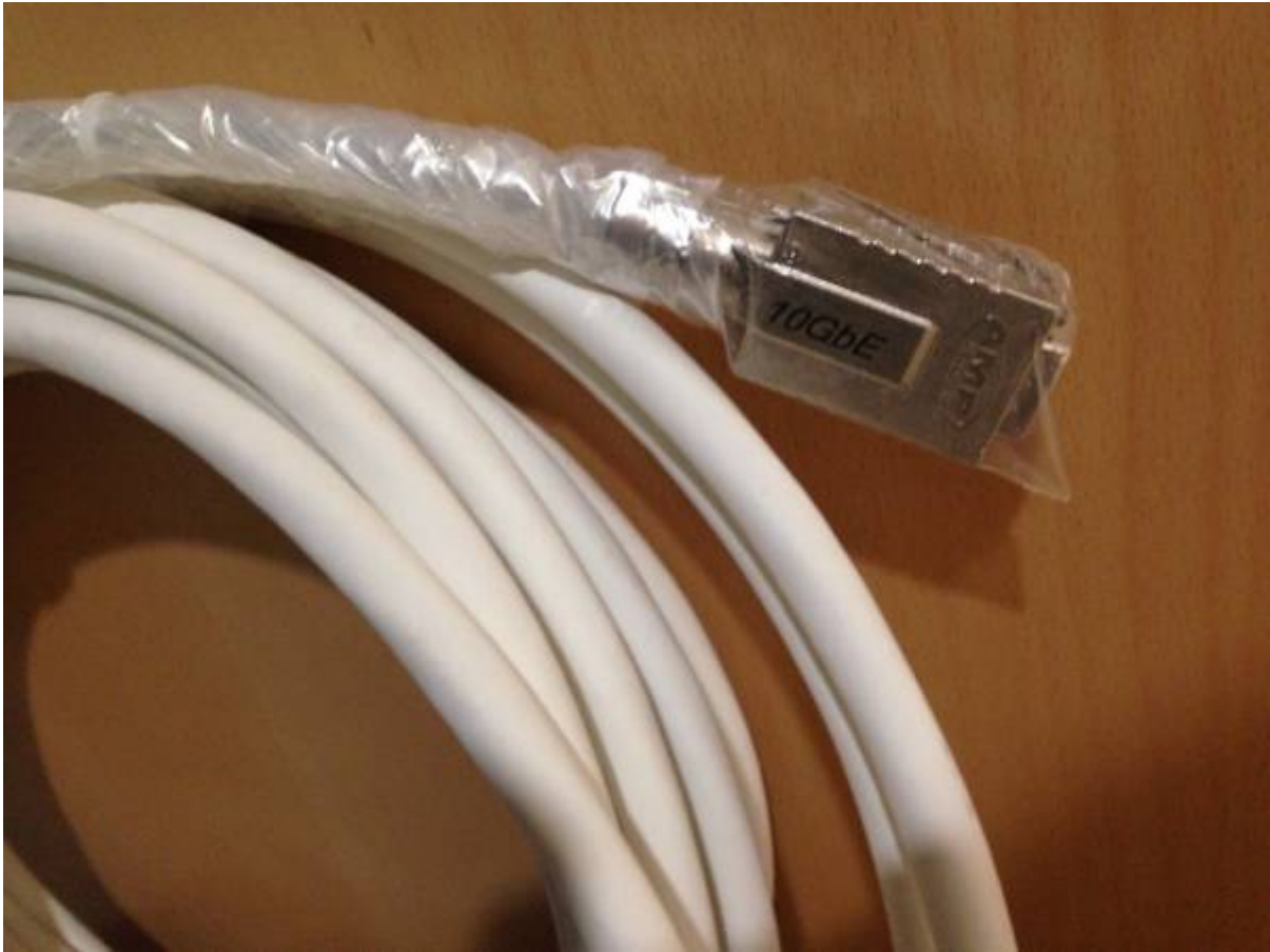
Panel de 48 bocas a 10 Gb conectado