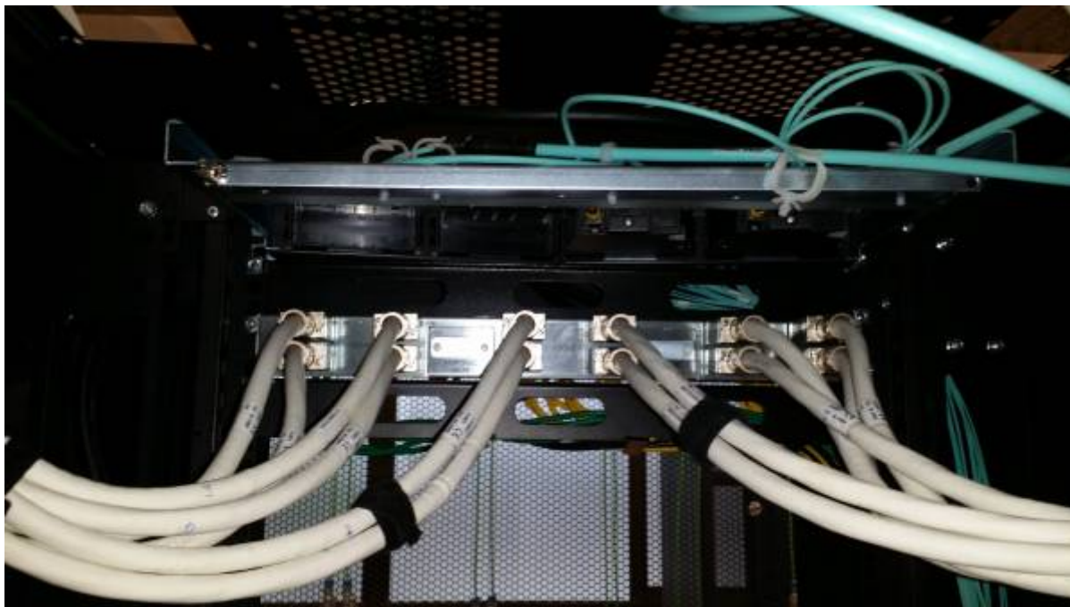
Vista frontal del Rack con las conexiones