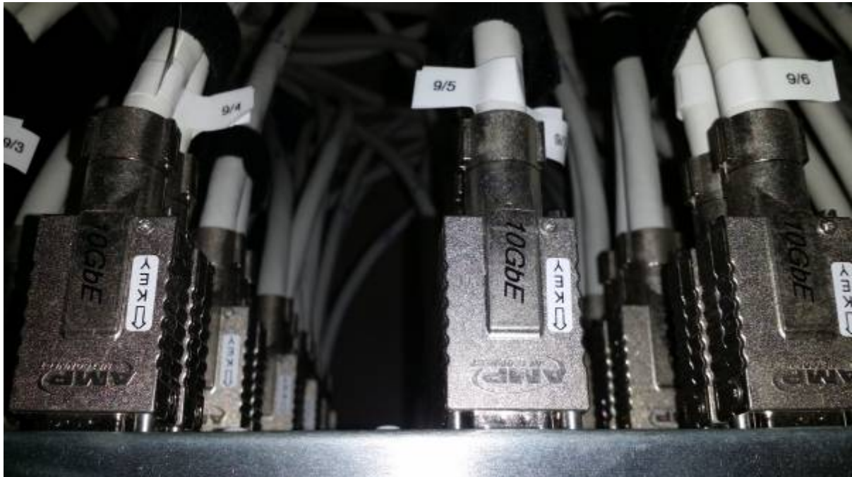
Vista posterior de las conexiones del Rack con 24 conexiones de fibra y un panel de 48 bocas a 10 Gb